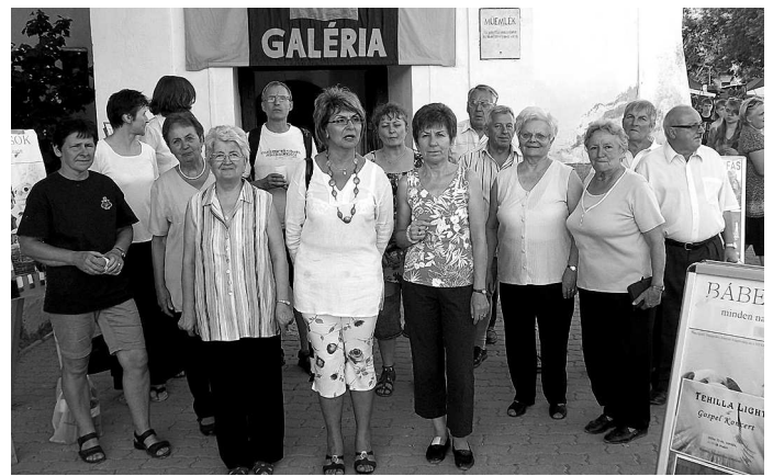
Az énekkar tagjai a kapolcsi evangélikus templom előtt

Megjelenik Kőszegen, évente két alkalommal.