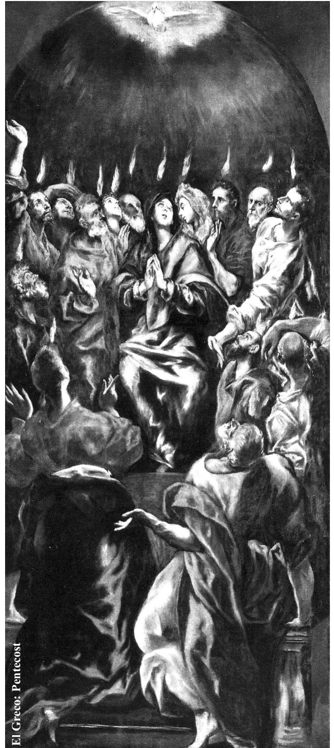
El Greco: Pentecost

Június elején kezdődik Stuttgartban az Protestáns Egyházi Napok következő alkalma, melynek mottója a 90. Zsoltár verse: ...hogy bölcs szívhez jussunk . Aztán két év múlva 2017-ben Berlinben és Wittenbergben a jubileumi protestáns Kirchentag-ra készülnek a reformáció orszá-