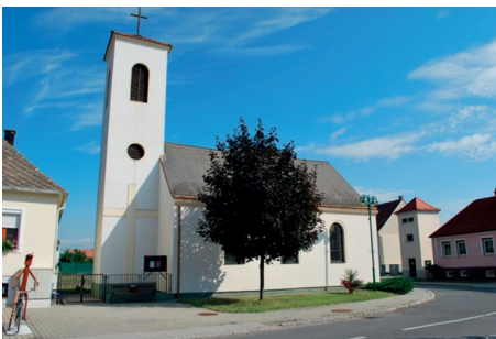
A régi evangélikus iskola helyén 1958-ban épült evangélikus templom Felsőlászlón

el lenne vágva. Mi továbbra is az ág. hitv. ev. anyaszentegyház közösségén belül akarunk élni, és Istennek országát azokon a kötelékeken belül építeni és fenntartani, melyeket nekünk az isteni gondviselés már századok óta ki-