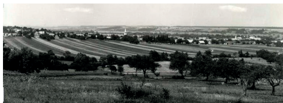
Felsőlászló 1945 előtt

2. Örömmel üdvözljük úgy az országban mint az egyházon belül felmerült azon nézeteket és mozgalmakat melyek a mi édes hazánk felvirágozását és ápolását célozzák – úgy különösen, hogy újra biztosítatik minden egyes állampolgár illetőleg egyháztag sajátos anyanyelvének joga. Egyházi és hitépítési szempontból kérjük és elvárjuk a kerület intéző köreinek bölcsességétől, hogy a hitélet fejlesztésének céljából, most még jobban hangsúlyozza teológusainknak a német illetőleg a vend nyelven való ki-