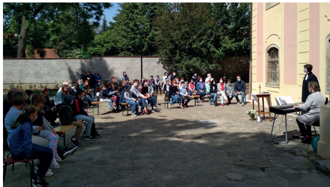
Az első családi istentisztelet május 24-én

ez a kérdés, hogy a gyülekezeti levelező listákra is elküldték gondolataikat. Nagyon jó volt látni, hogy sokak figyelme nem csak a sopánkodásig terjed, hanem a konkrét cselekvésig. Ezeknek a leveleknek nyomán érkeztek rendszeresen egyházfenntartói befizetések, adományok, perselypénzek. Egyházunk által elindított e-perselyen keresztül is kaptunk adományokat. S arra is volt példa, hogy valaki megnézte a videós istentiszteletünket az ország más pontján, és aznap a perselypénzt gyülekezetünknek utalta. Köszönet az adományokért, és azért a figyelmességért, hogy gyülekezetünk nem vált ebben az időszakban sem működésképtelenné.